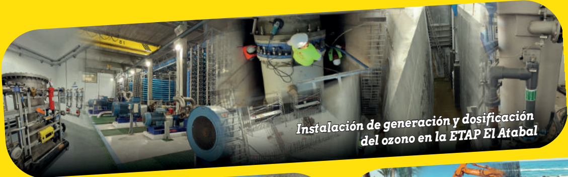
Instalación de generación y dosificación del ozono en la ETAP El Atabal

"Empresa con Obras Emblemáticas en Colombia y otros Países Latinoamericanos."