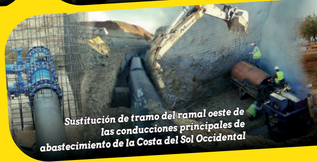
Sustitución de tramo del ramal oeste de las conducciones principales de abastecimiento de la Costa del Sol Occidental

GEOTÉCNIA · HIDRÁULICAS MOVIMIENTOS DE TIERRA · PISTAS DEPORTIVAS AFIRMADOS · ESTRUCTURAS · URBANIZACIÓN TRATAMIENTO AMBIENTAL · OBRA FERROVIARIA