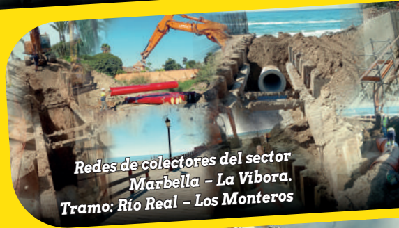
Redes de colectores del sector Marbella - La Vibora. Tramo: Río Real - Los Monteros