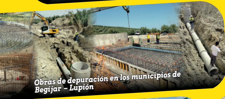
Obras de depuración en los municipios de Begíjar - Lupión