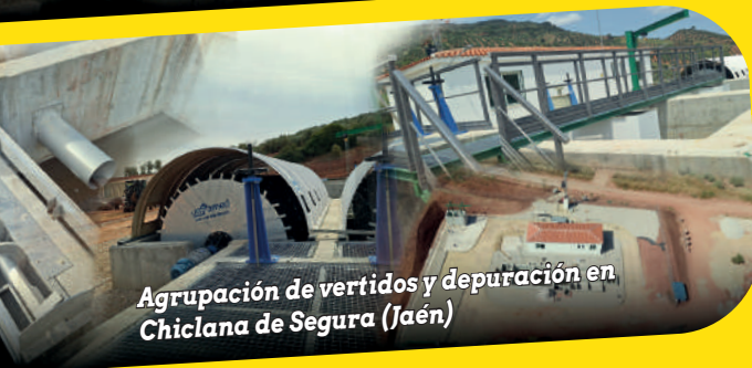
Agrupación de vertidos y depuración en Chiclana de Segura (Jaén)