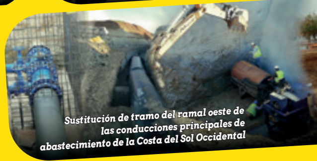
Sustitución de tramo del ramal oeste de las conducciones principales de abastecimiento de la Costa del Sol Occidental

GEOTÉCNIA · HIDRÁULICAS MOVIMIENTOS DE TIERRA · PISTAS DEPORTIVAS AFIRMADOS · ESTRUCTURAS · URBANIZACIÓN TRATAMIENTO AMBIENTAL · OBRA FERROVIARIA