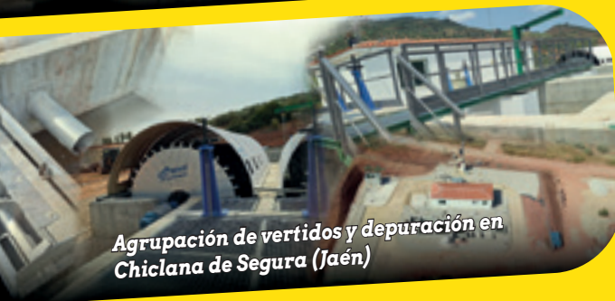
Agrupación de vertidos y depuración en Chiclana de Segura (Jaén)