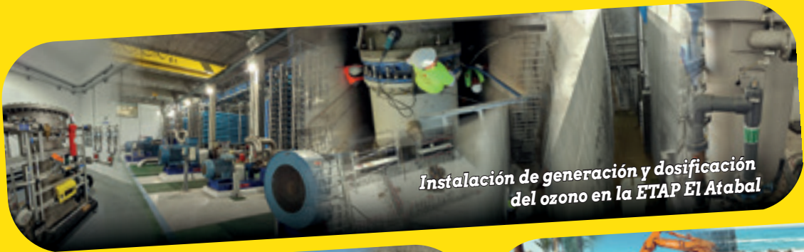
Instalación de generación y dosificación del ozono en la ETAP El Atabal

"Empresa con Obras Emblemáticas en Colombia y otros Países Latinoamericanos."