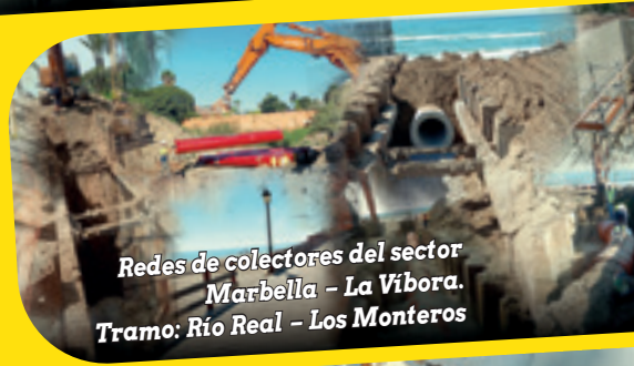
Redes de colectores del sector Marbella - La Vibora. Tramo: Río Real - Los Monteros