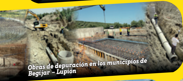
Obras de depuración en los municipios de Begíjar - Lupión