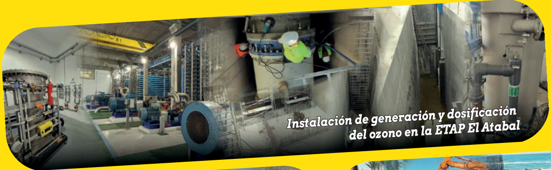
Instalación de generación y dosificación del ozono en la ETAP El Atabal

"Empresa con Obras Emblemáticas en Colombia y otros Países Latinoamericanos."