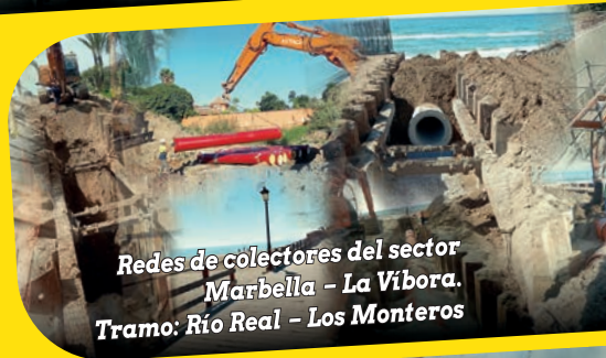
Redes de colectores del sector Marbella - La Víbora. Tramo: Río Real - Los Monteros