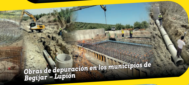
Obras de depuración en los municipios de Begíjar - Lupión