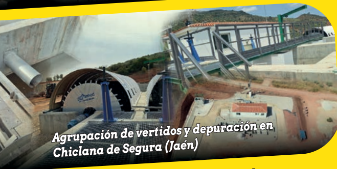
Agrupación de vertidos y depuración en Chiclana de Segura (Jaén)