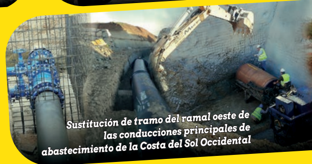
Sustitución de tramo del ramal oeste de las conducciones principales de abastecimiento de la Costa del Sol Occidental

GEOTÉCNIA · HIDRÁULICAS MOVIMIENTOS DE TIERRA · PISTAS DEPORTIVAS AFIRMADOS · ESTRUCTURAS · URBANIZACIÓN TRATAMIENTO AMBIENTAL · OBRA FERROVIARIA